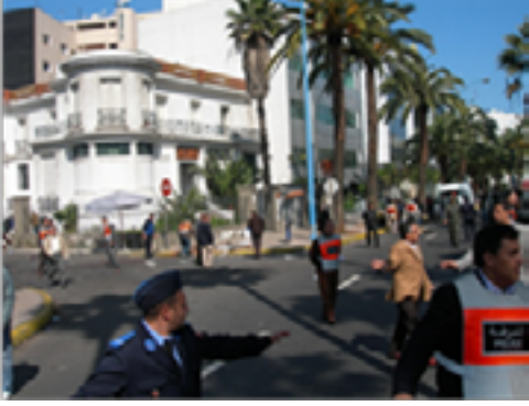
التفجيرات التي طالت مدينة الدار البيضاء المغربية عام 2003 كانت مثالا على ضياع بوصلة هذه التنظيمات.

قامت فكرة تنظيم القاعدة على مبدء أساسي يقوم على تغيير الأنظمة العربية وإجلاء القوات الغربية من جزيرة العرب. هذا التغيير اتخذ العنف والقوة وسيلة له. فالأمر كان من وجهة نظر مؤسسي التنظيم مهما وضروريا لإنهاء الضعف والهوان الذي يعيش فيه العرب والمسلمون.