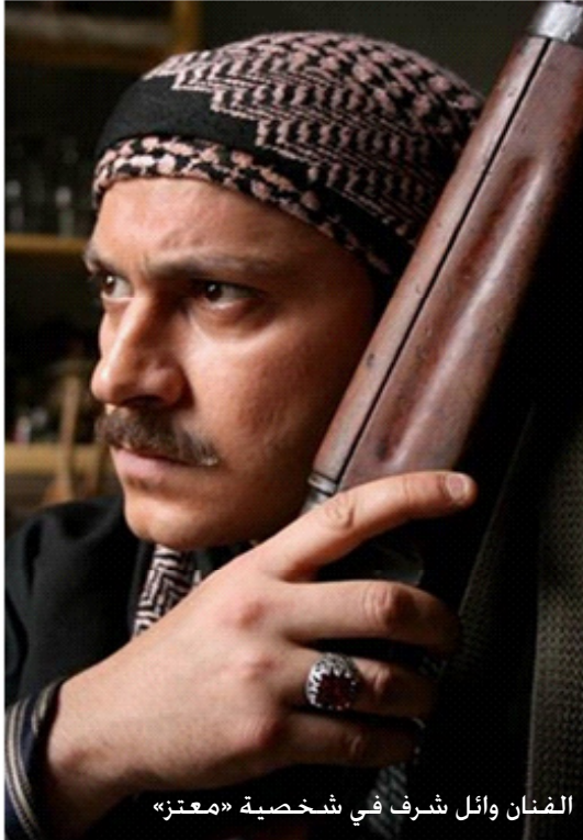
الفنان وائل شرف في شخصية «معتز»

لن أبالغ حينما أقول أنني لست من المتابعين للتلفزيون خلال رمضان أو في غير رمضان. فالبرامج التلفزيونية لم تعد تستهويني كما كانت قبلا.