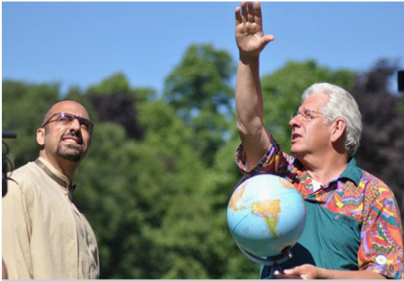
أحمد الشقيري في أحد حلقات برنامج خواطر 6 مع آدم هارت

على الرغم من انتشار ما يسمى بالإعلام الهادف متمثلاً بالقنوات الإسلامية في الآونة الأخيرة وما صاحب ذلك من زخم في البرامج التي تُعرض على شاشات التلقزة خاصة خلال شهر رمضان المبارك، إلا أنك ستلمح من خلال ما يعرض هشاشة واضحة في التجربة، وكيف أن هذا الإعلام ما زال يقبع في غياهب التفكير النمطي والتقليدي للقائمين عليه.